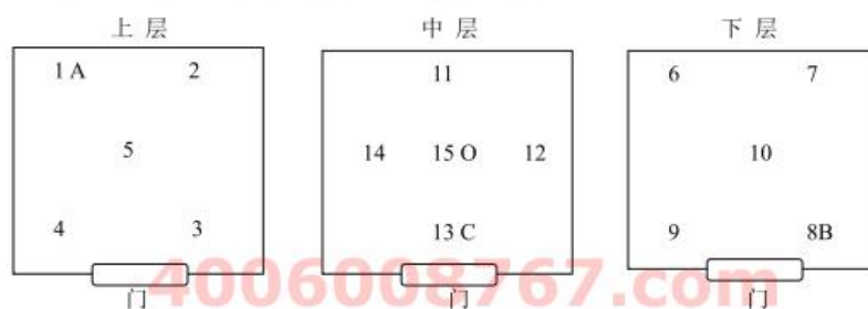
图 2 设备容积大于 2\text{m}^3 布点示意图

7.2.3.2 设备容积大于 2\text{m}^3 时，温度测量点为 15 个，湿度测量点为 4 个，温度点 15、湿度点 O 位于设备工作空间中层几何中心处，如图 2 所示。