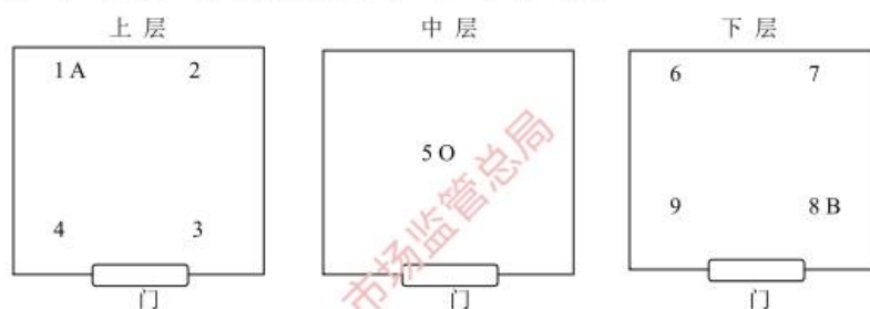
图 1 设备容积小于等于 2\text{m}^3 布点示意图

7.2.3.1 设备容积小于等于 2\text{m}^3 时，温度测量点为 9 个，湿度测量点为 3 个，温度点 5、湿度点 O 位于设备工作空间中层几何中心处，如图 1 所示。